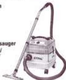
STIHL Universalsauger von 1,2 kW bis 1,5 kW