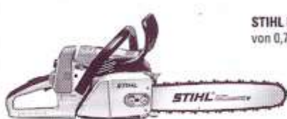
STIHL Motorsensen von 0,7 kW bis 2,8 kW