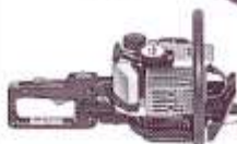
STIHL Heckenscheren von 0,75 kW bis 0,95 kW